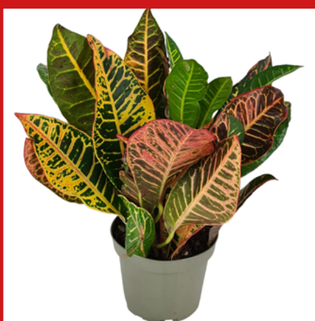
TRÓJSKRZYN PSTRY silnie trujący