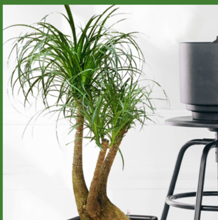
NOLINA WYGIĘTA "NOGA SŁONIA"