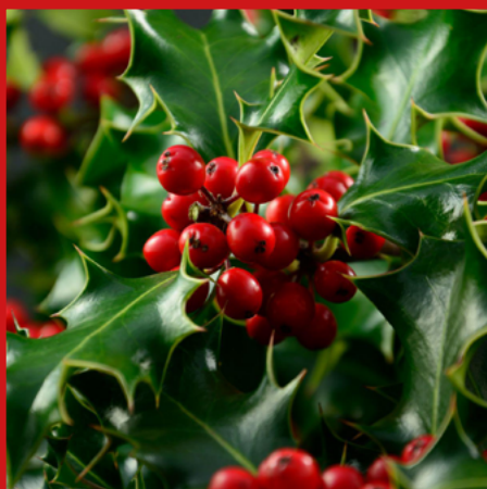
OSTOKRZEW AMERYKAŃSKI bardzo trujący