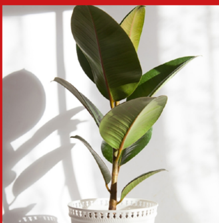
FIKUS wszystkie rodzaje