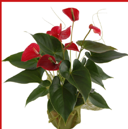
ANTURIUM bardzo trujące