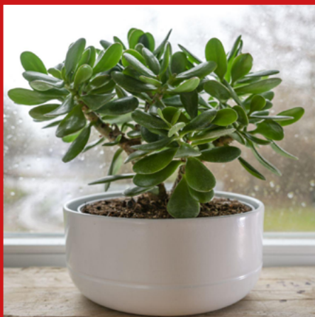
GRUBOSZ wszystkie rodzaje