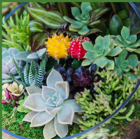
SUKULENTY (nie wszystkie)