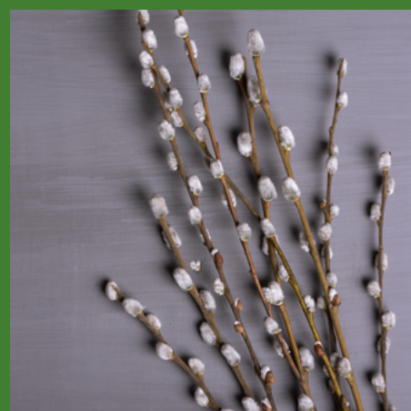
WIERZBA (BAZIE KOTKI) bezpieczna w małych ilościach

Dane pochodzą ze strony ASPCA https://www.aspc.org/pet-care/animal-poison-control/toxic-and-non-toxic-plant , gdzie można szukać roślin po ich nazwach łacińskich.