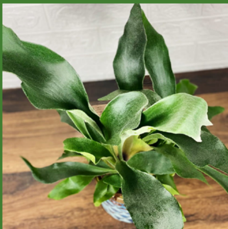
PAPROĆ "ŁOSIE ROGI"