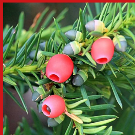
CIS bardzo trujący