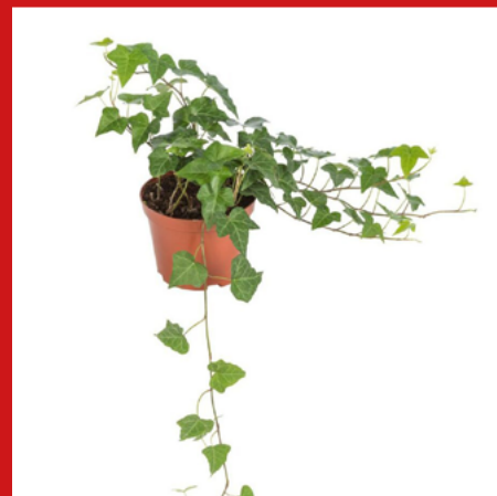
BLUSZCZ bardzo trujący