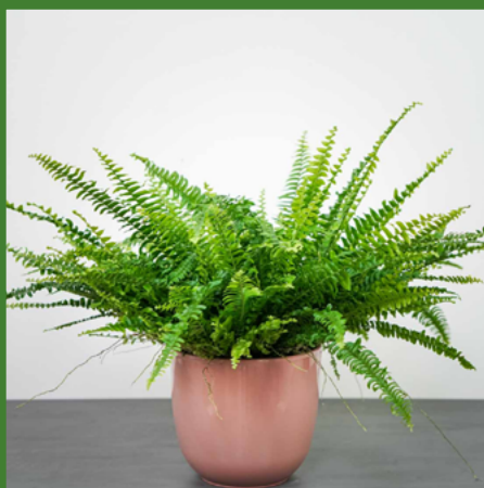
PAPROĆ NEFROLEPIS WYNIOSŁY